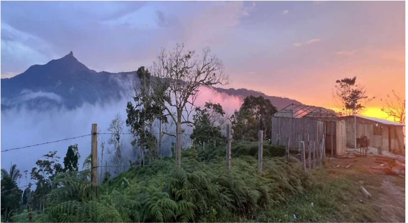
Fotografía a la serranía de san Lucas.